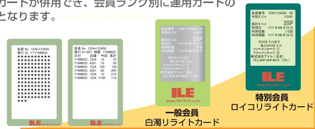
新規会員 追記式サマーカード